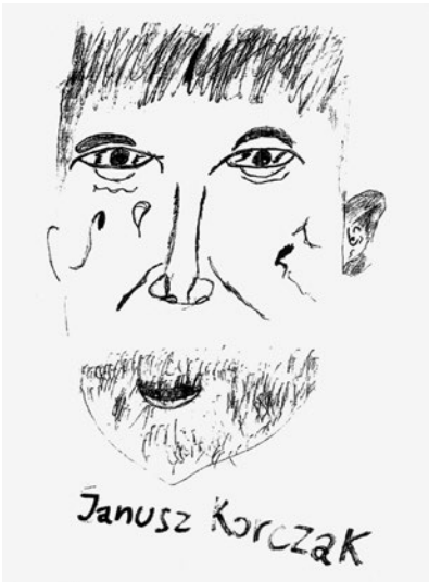
Abb. 5: Korczak schaut traurig