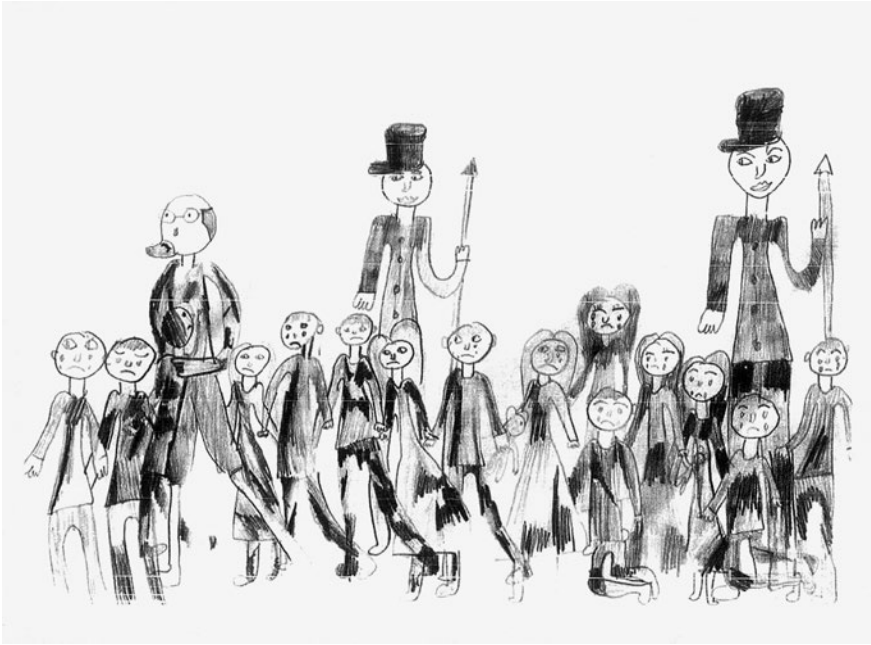
Abb. 4: Korczak und Frau Stefa mit ihren Kindern auf dem Weg nach Treblinka