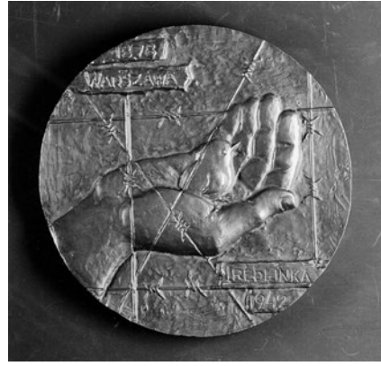
Abb. 7: Lev Razumovski, Korczaks Selbst- und Nächstenliebe (Treblinka)

Versuche ich beide Bilder mit Korczaks 19 Meditationen Gebete eines Menschen, der nicht betet – Allein mit Gott (Korczak 1980) zu verstehen, dann verschmilzt die in Warschau geübte Achtung mit der Selbst- und Nächstenliebe zu einer untrennbaren Einheit, die sowohl für Korczak selbst, für seine Haltung und eigene Entwicklung als auch für die Wirksamkeit (s)einer Pädagogik von hoher, wenn nicht gar höchster Bedeutung ist. 4