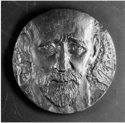
Abb. 6: Lev Razumovski, Korczaks offener Blick (Warschau)