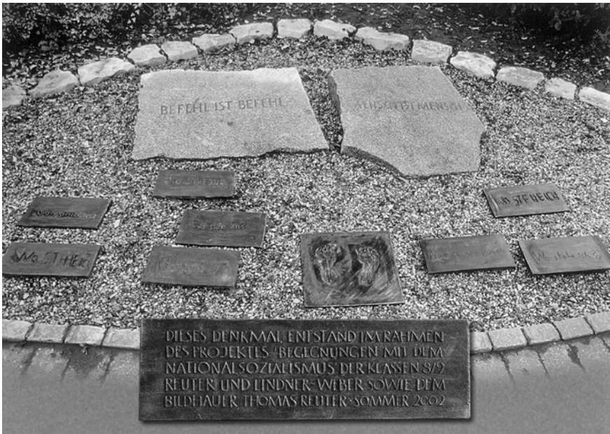
Abb. 3: Das Denkmal entstand 2002 im Rahmen des Projekts Begegnungen mit dem Nationalsozialismus der Klassen 8/9 des Förderzentrums für Körperbehinderte, Wichernhaus Altdorf (bei Nürnberg), Rummelsberger Dienste für Menschen mit Behinderungen.